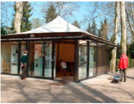
Ausstellungspavillon auf dem St. Thomas-Friedhof