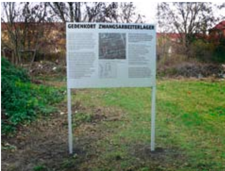
Gedenktafel am Lagerstandort