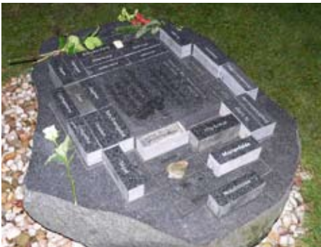
Gedenkstein auf dem Kirchhof der Jerusalems- und Neuen Kirchengemeinde mit abgelegten Steinen